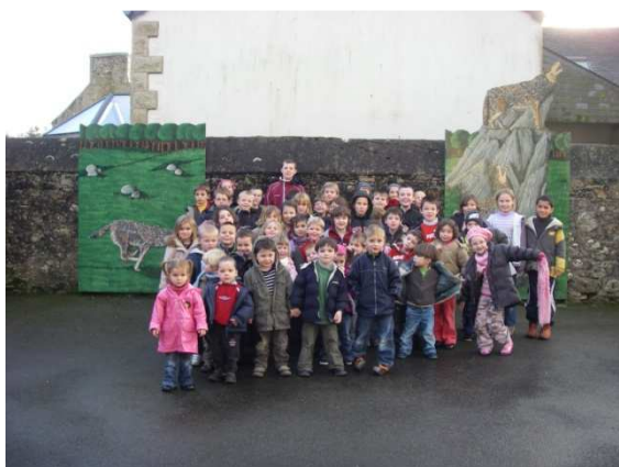
Visite au musée du loup à Ménez-Meur

Le 9 décembre l'ensemble de l'école s'est rendu au parc de Ménez-Meur à Hanvec. Ils y ont vu plusieurs espèces d'animaux et en particulier le loup. Tout ébahis, ils ont assisté au repas des loups. Puis, direction le musée du loup au cloître-Saint-Thégonnec. Ils ont découverts des loups naturalisés, des pièges à loups, des histoires incroyables... depuis nos petits loups ont accompli un gros travail de rédaction et de mise en image de leur sortie.